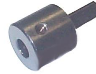
CF CRVCF QT'F'G'VCNCF TQ