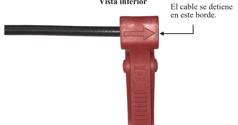
Figura 2 Vista inferior

2. Coloque el cable entre las mandíbulas de la herramienta en la dirección de la flecha en la parte inferior de la herramienta, como en la Figura 2. Las mandíbulas se abren presionando la palanca A en la figura 1. Coloque el extremo del cable en el borde derecho de la mandíbula inferior como se indica en la Figura 2. Esto asegurará una longitud adecuada del conductor. (Para los modelos de herramientas que se suministran con un tope de remoción integrado, coloque el extremo del cable en el tope en la mandíbula inferior. Esto también garantiza una longitud adecuada del conductor.